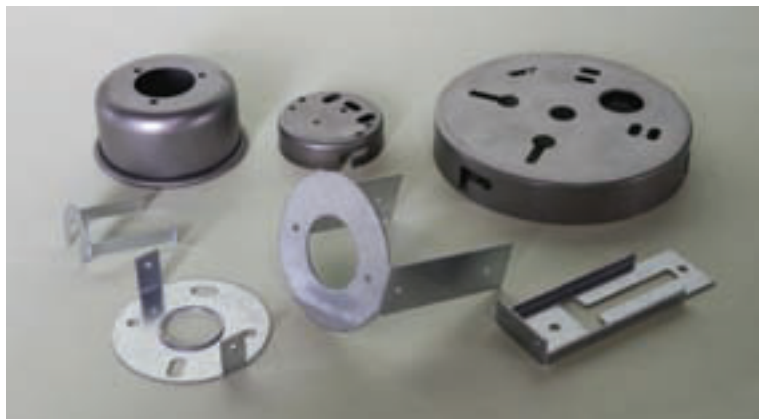
絞り、抜き、曲げ、切欠、穴アケ いろいろ