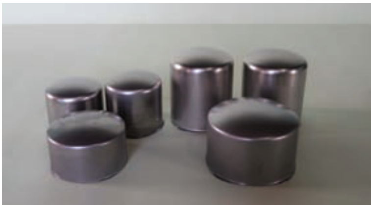
SUS 304 t0.5 左 \phi 70 \times 60h 右 \phi 80 \times 80h 各々 プレス絞り 2工程