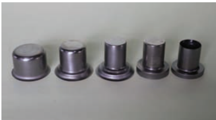
SPCB t0.6 上部 \phi 42 下部 \phi 65 \times 60h プレス絞り 4工程 トリム 1工程