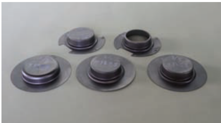
SPCE t0.6 上部 \phi 52 フランジ \phi 93 \times 18h プレス絞り 3工程 切欠、中抜き