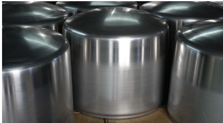
A1100 0 t2.5 φ 350× 305H ヘラ絞り加工