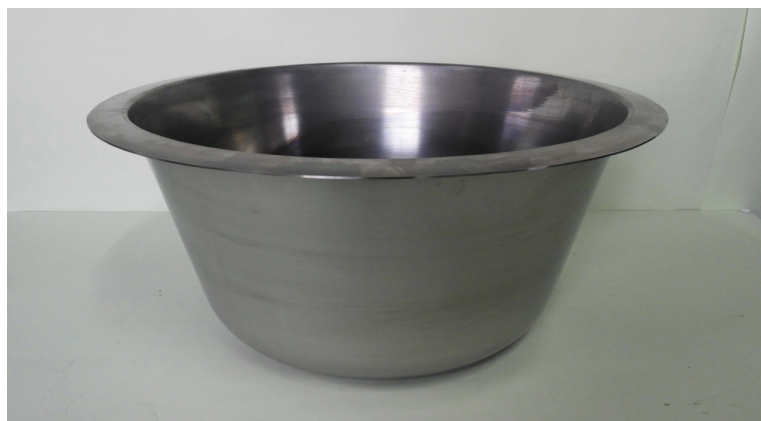
SUS304 t1.5 φ 450× 200H ヘラ絞り加工