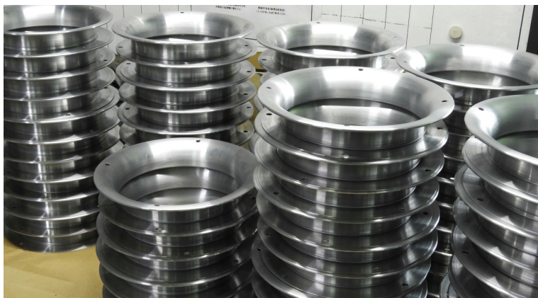
A1050 0 t1.2 φ 270× 35H ヘラ絞り加工 プレス孔アケ加工